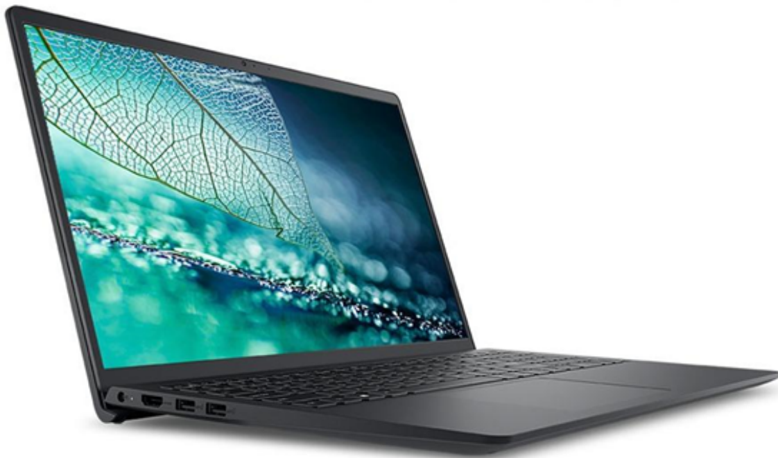
Notebook Inspiron 15 3000

Acesse Dell.com.br/cuponsmpp e garanta cupons de até R$500 de desconto, cumulativos com as ofertas vigentes.